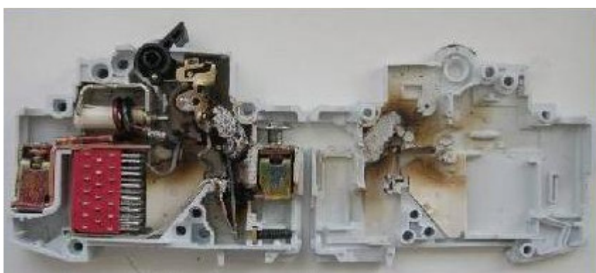
Etat d'une copie après court-circuit